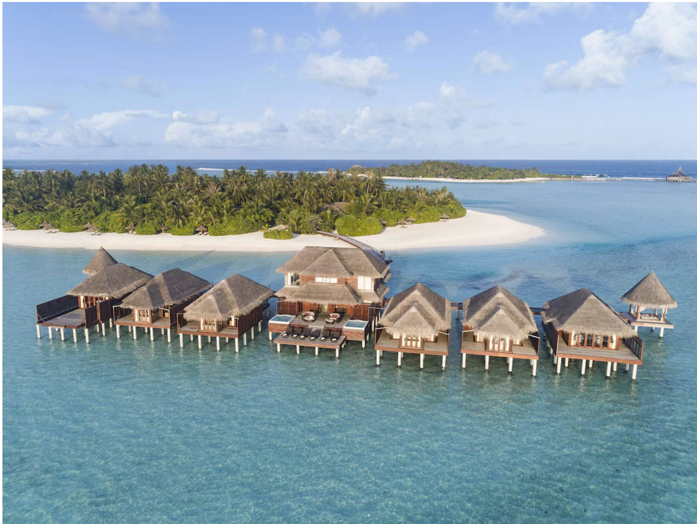
Süd Male Atoll