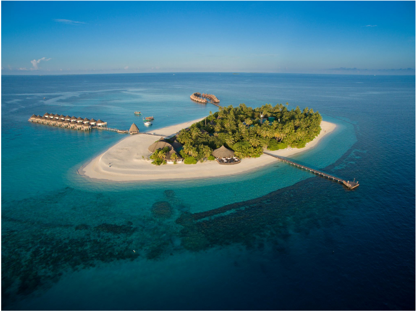
Süd Ari Atoll