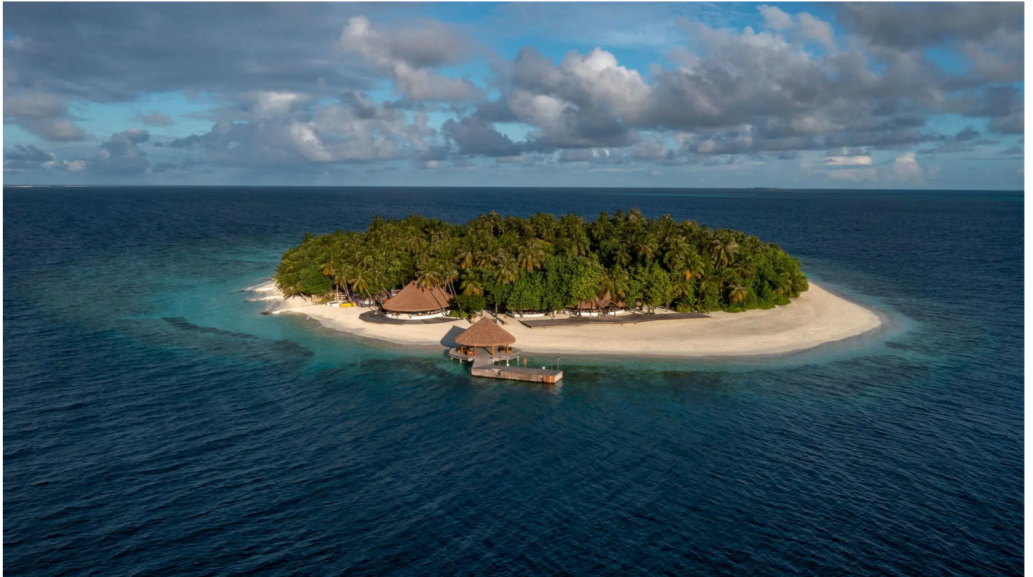
Nord Male Atoll