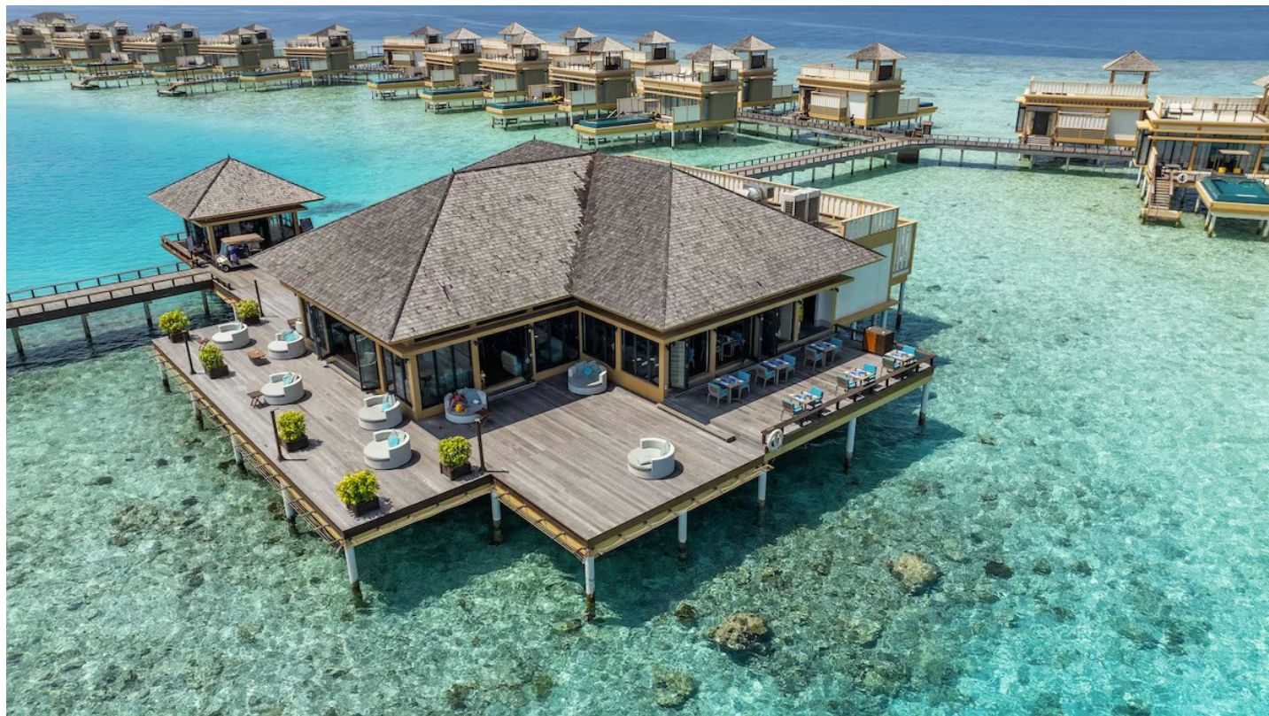
Süd Nilandhe Atoll