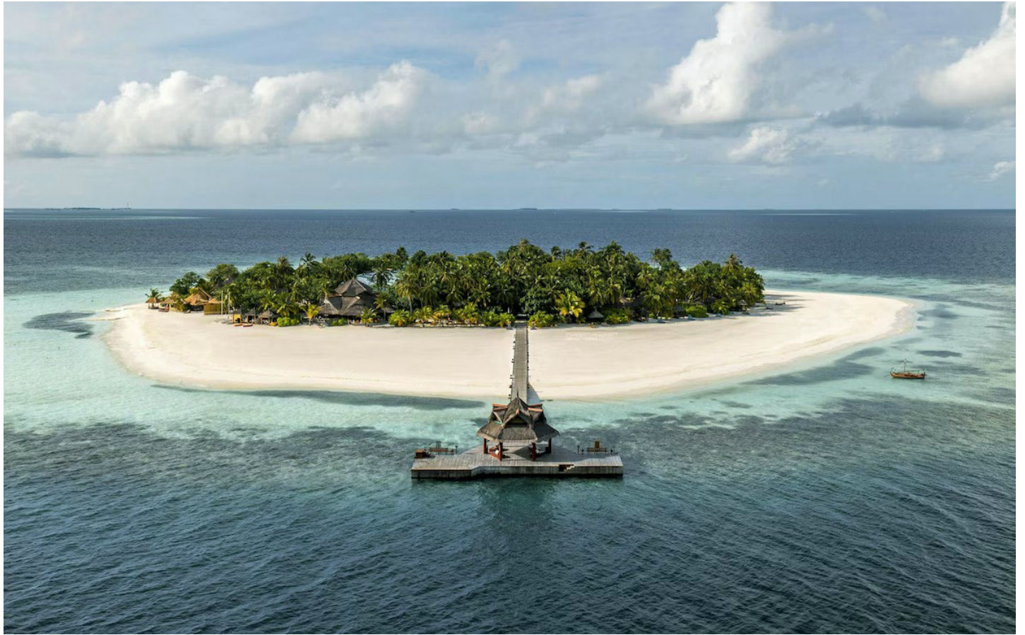
Nord Male Atoll