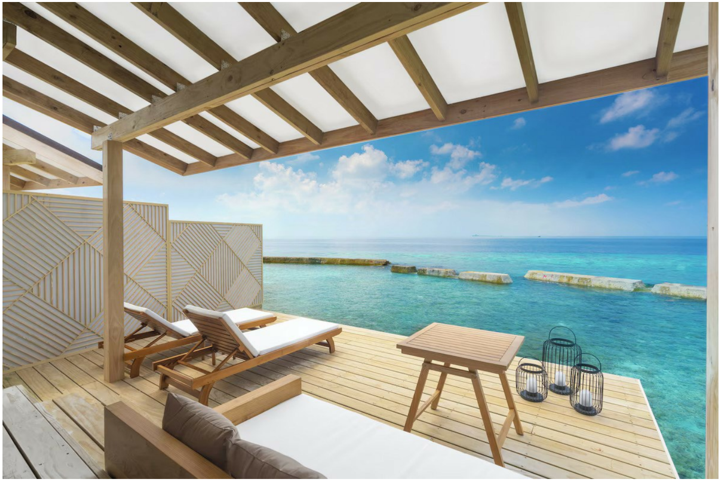
Nord Ari Atoll