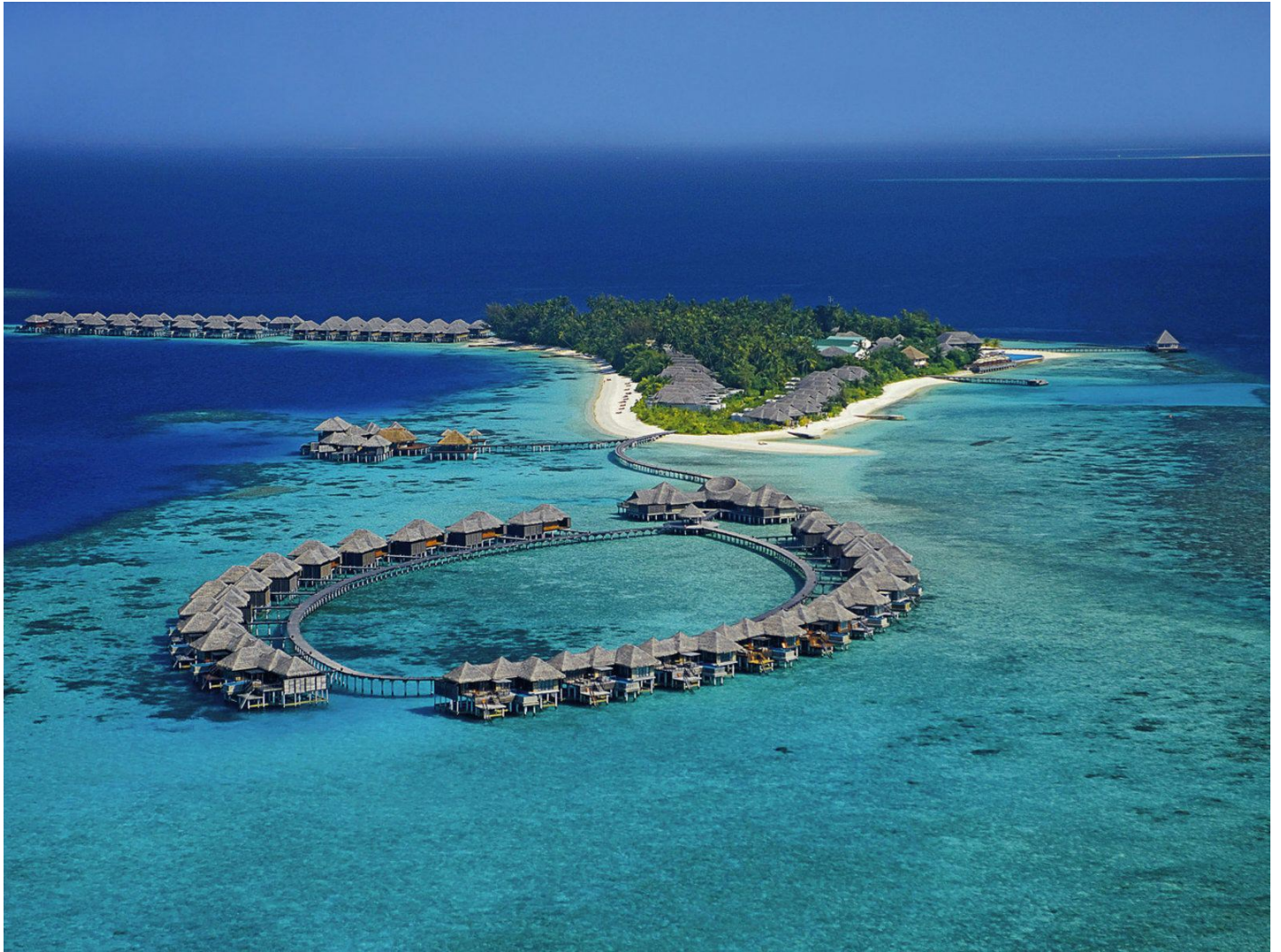
Nord Male Atoll