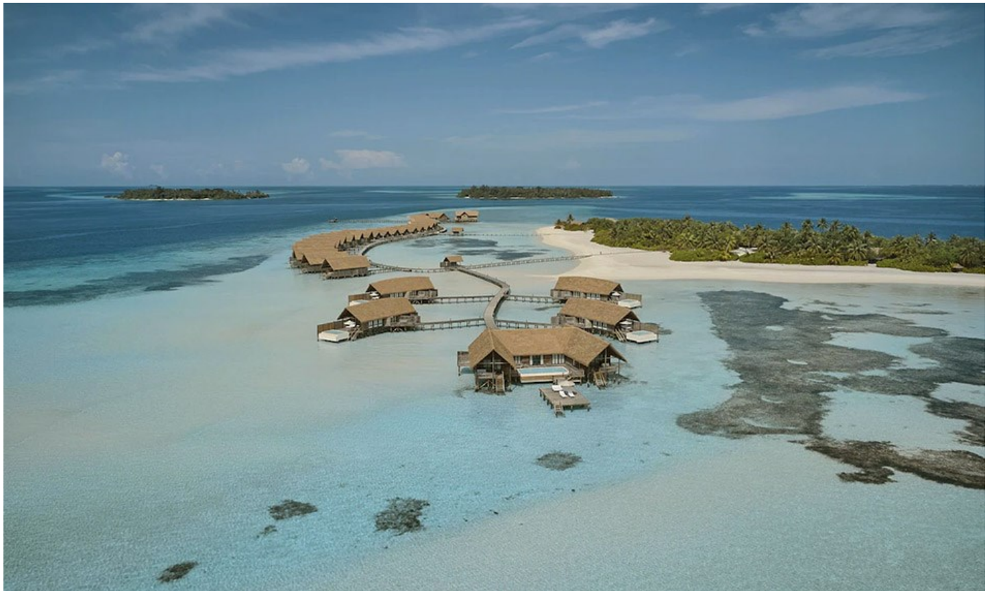
Süd Male Atoll