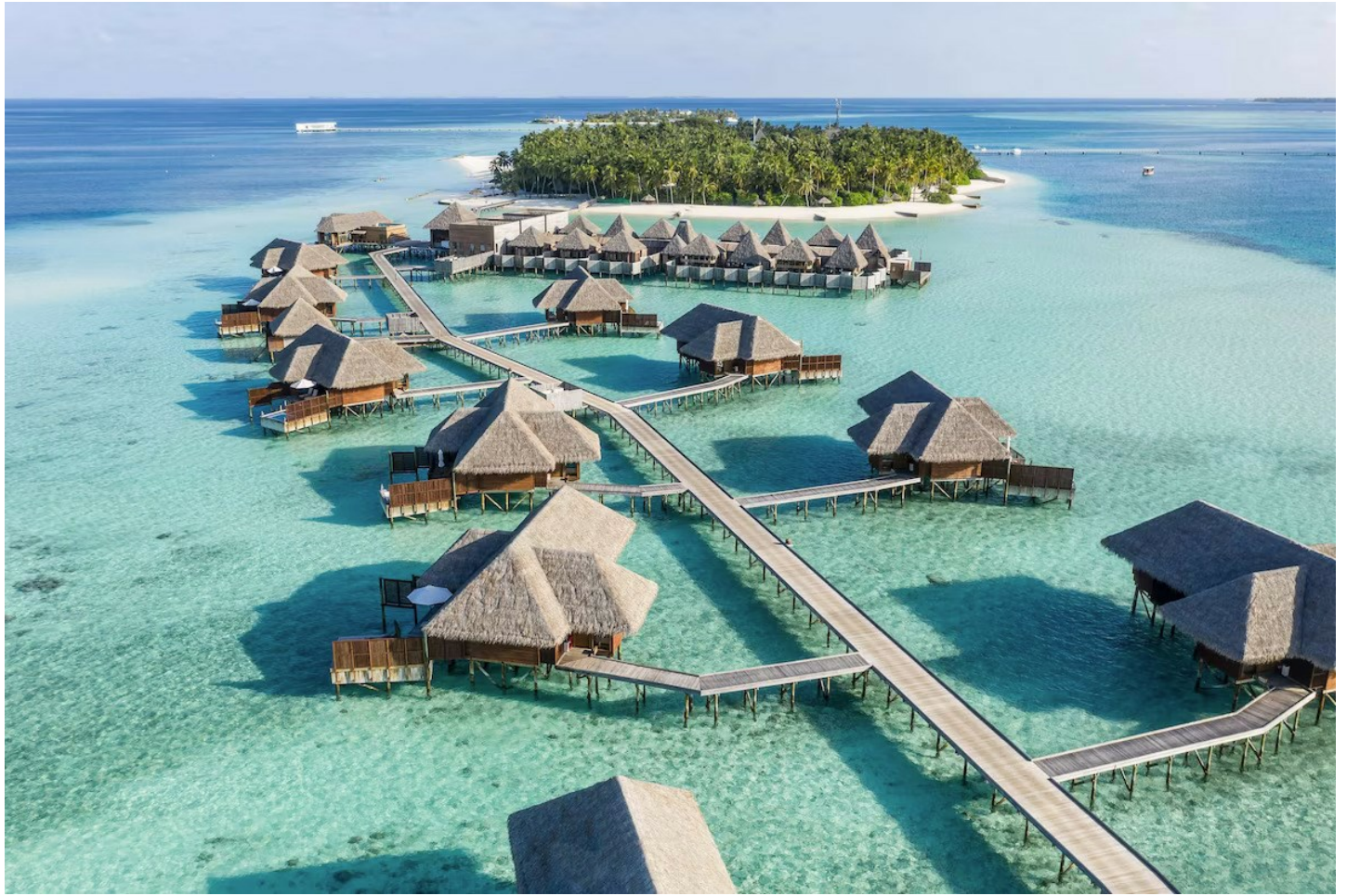
Süd Ari Atoll