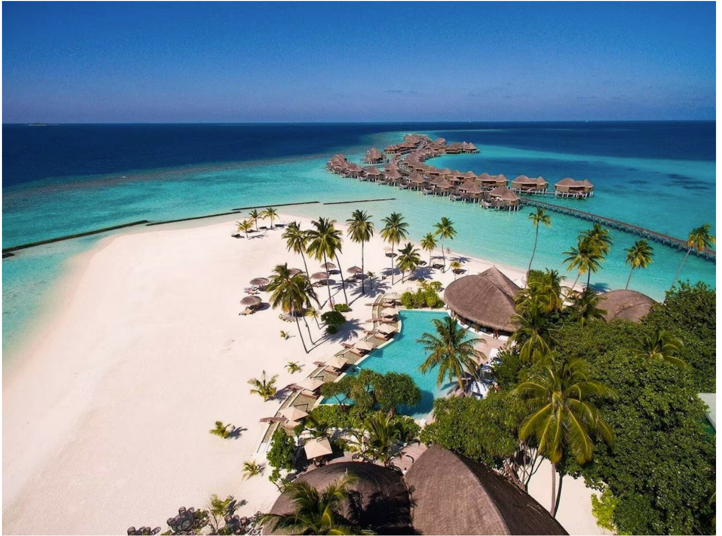
Nord Ari Atoll