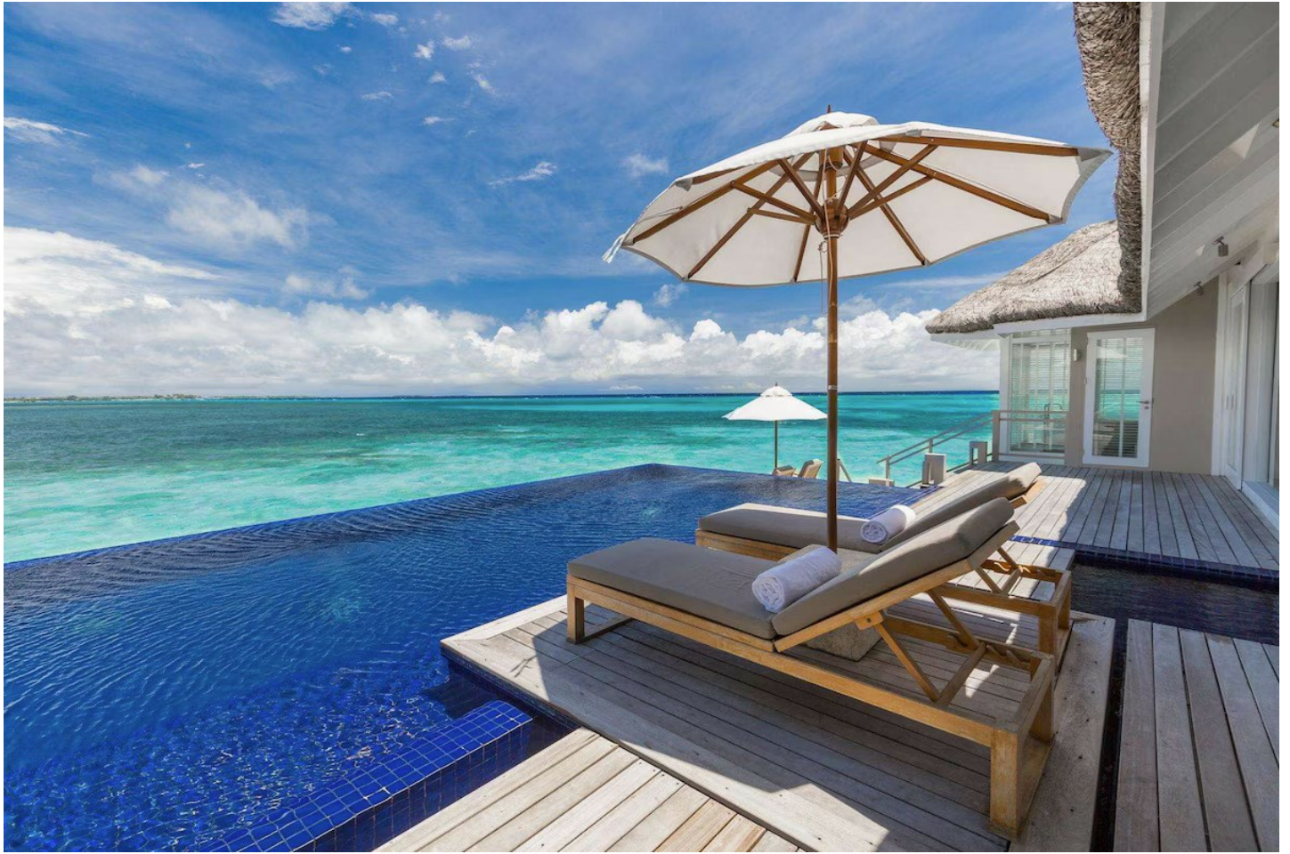
Süd Ari Atoll