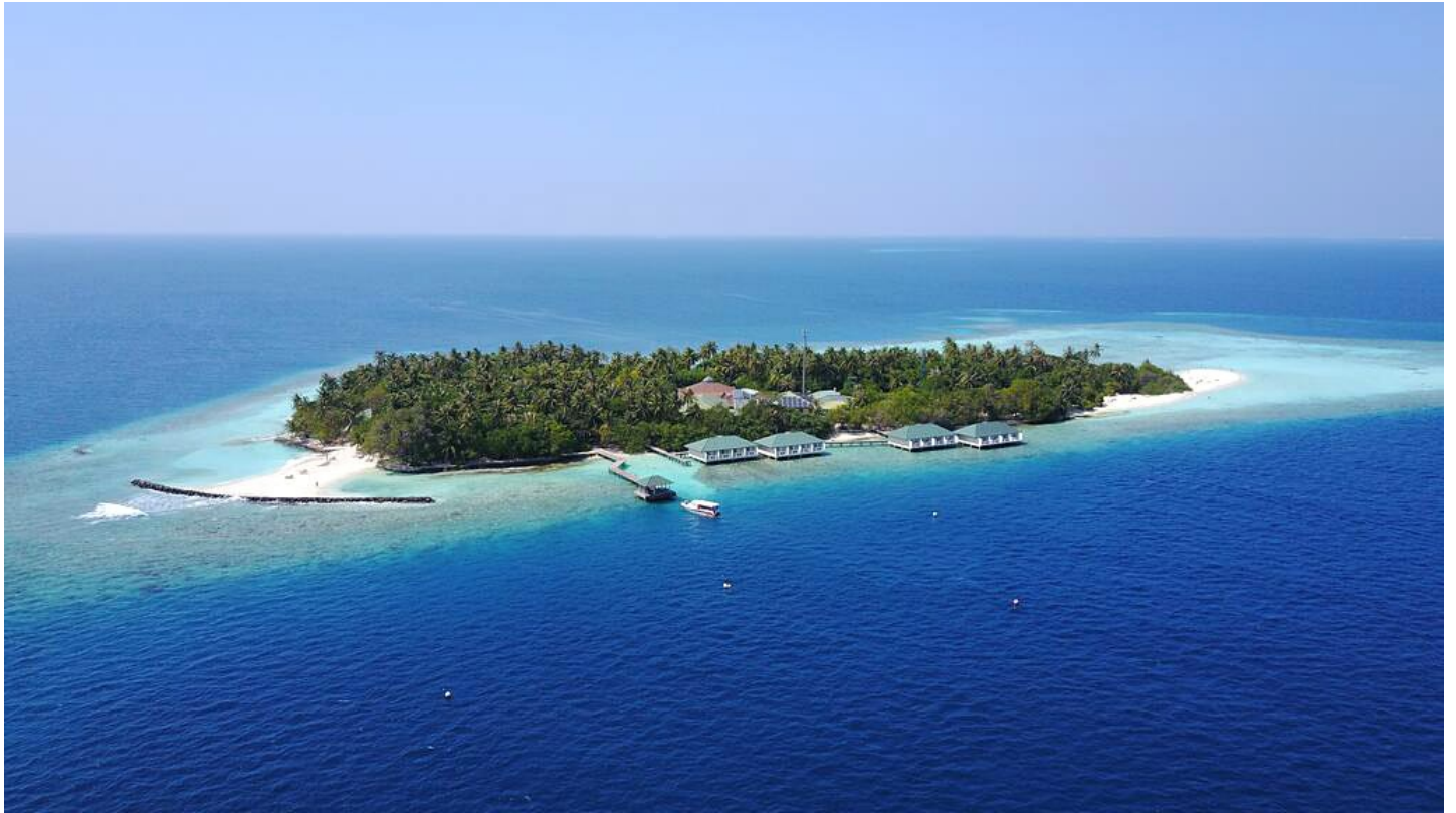
Süd Male Atoll