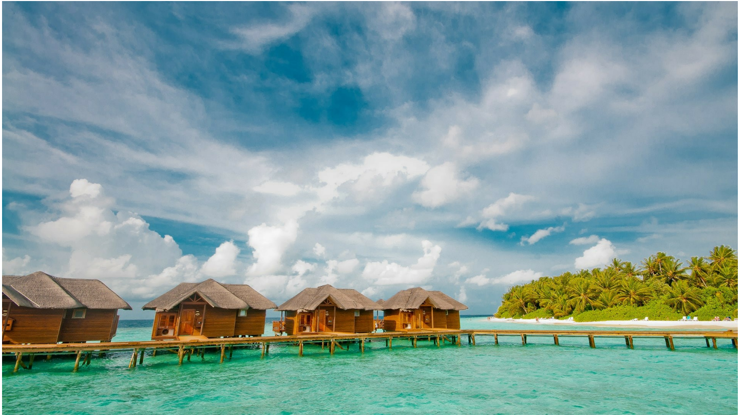
Süd Male Atoll