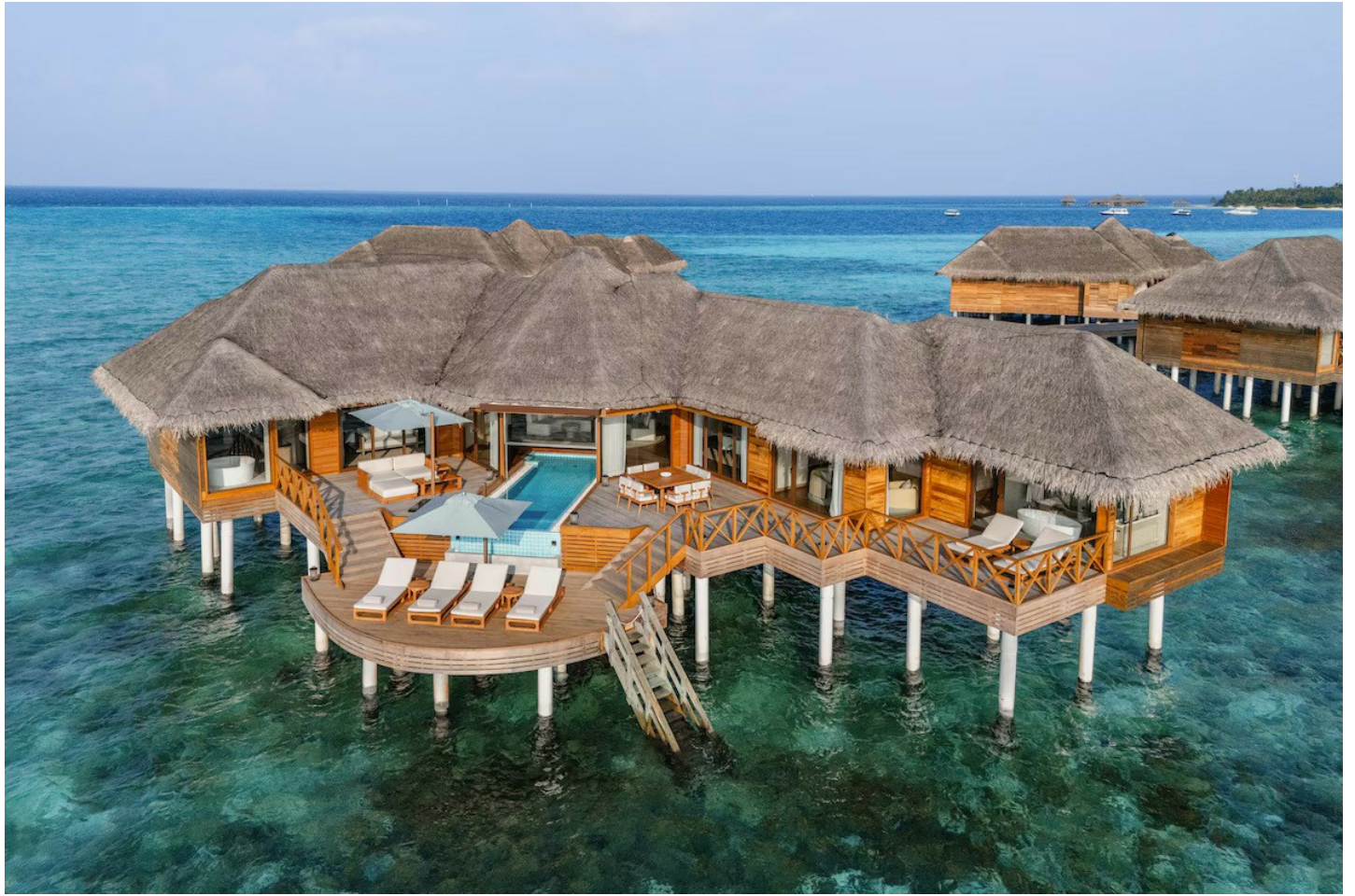
Nord Male Atoll