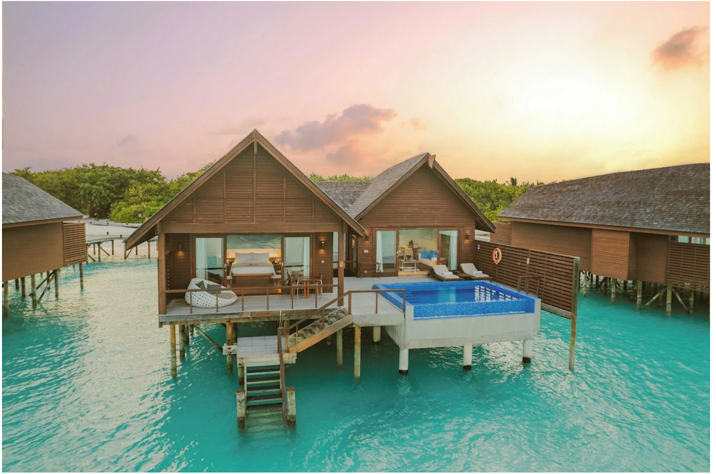
Haa Dhaalu Atoll