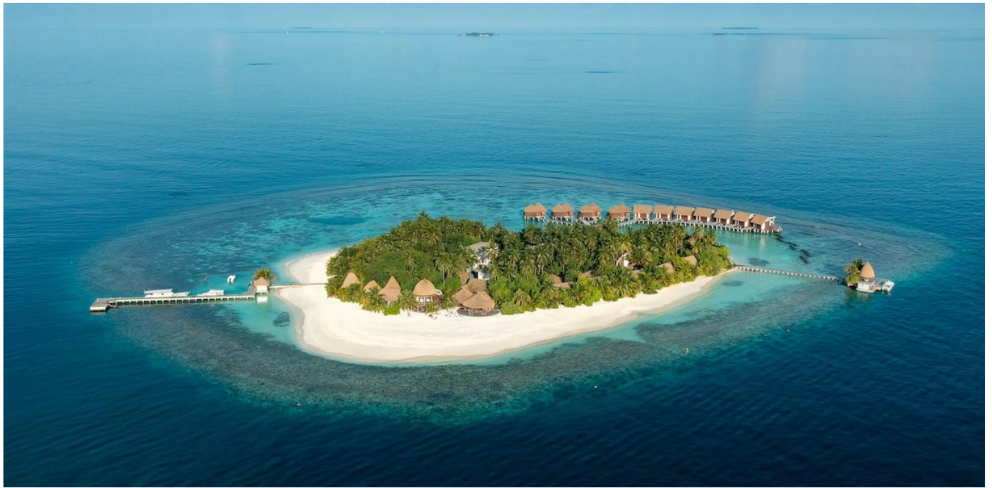
Nord Ari Atoll