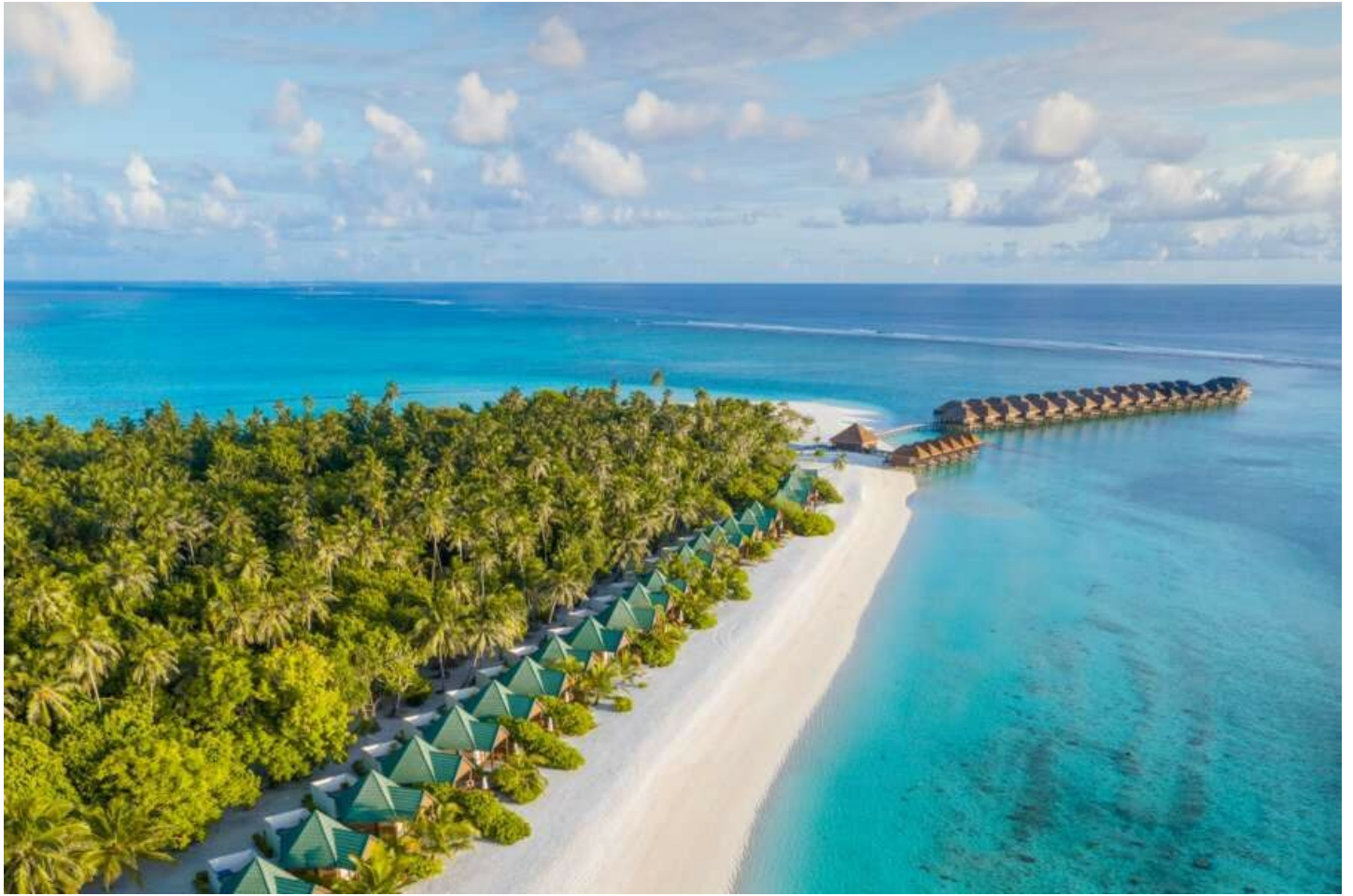
Nord Male Atoll