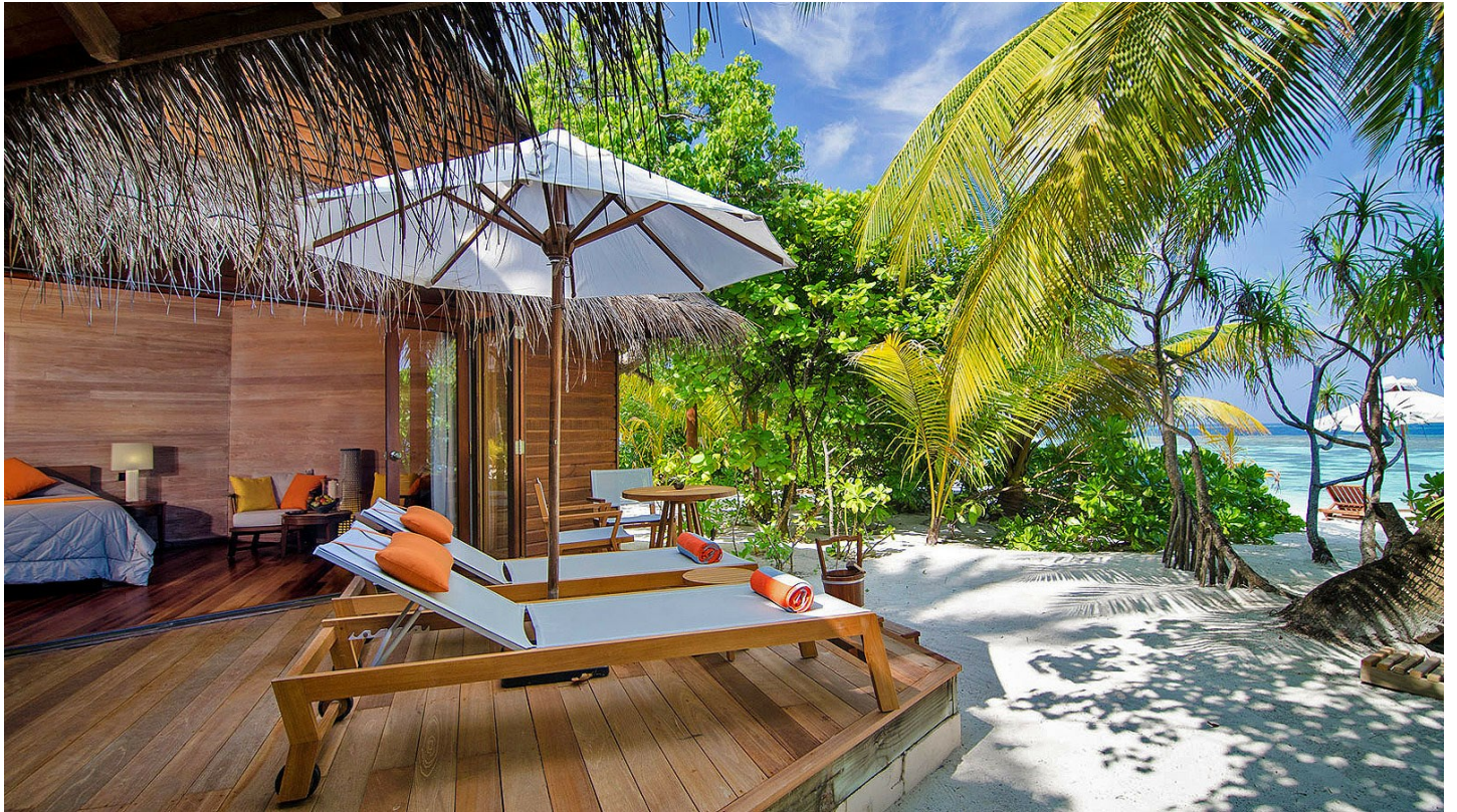
Süd Ari Atoll