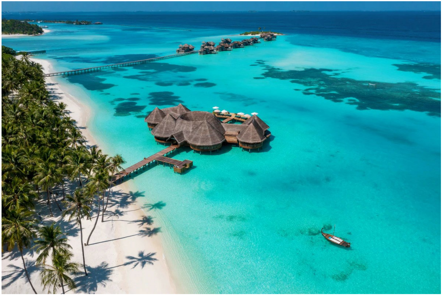
Nord Male Atoll