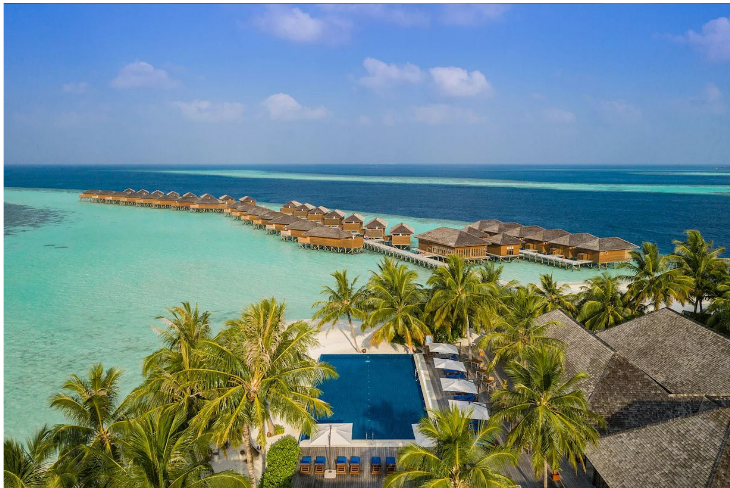
Süd Ari Atoll