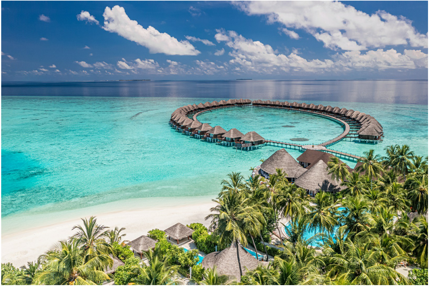
Süd Nilandhe Atoll