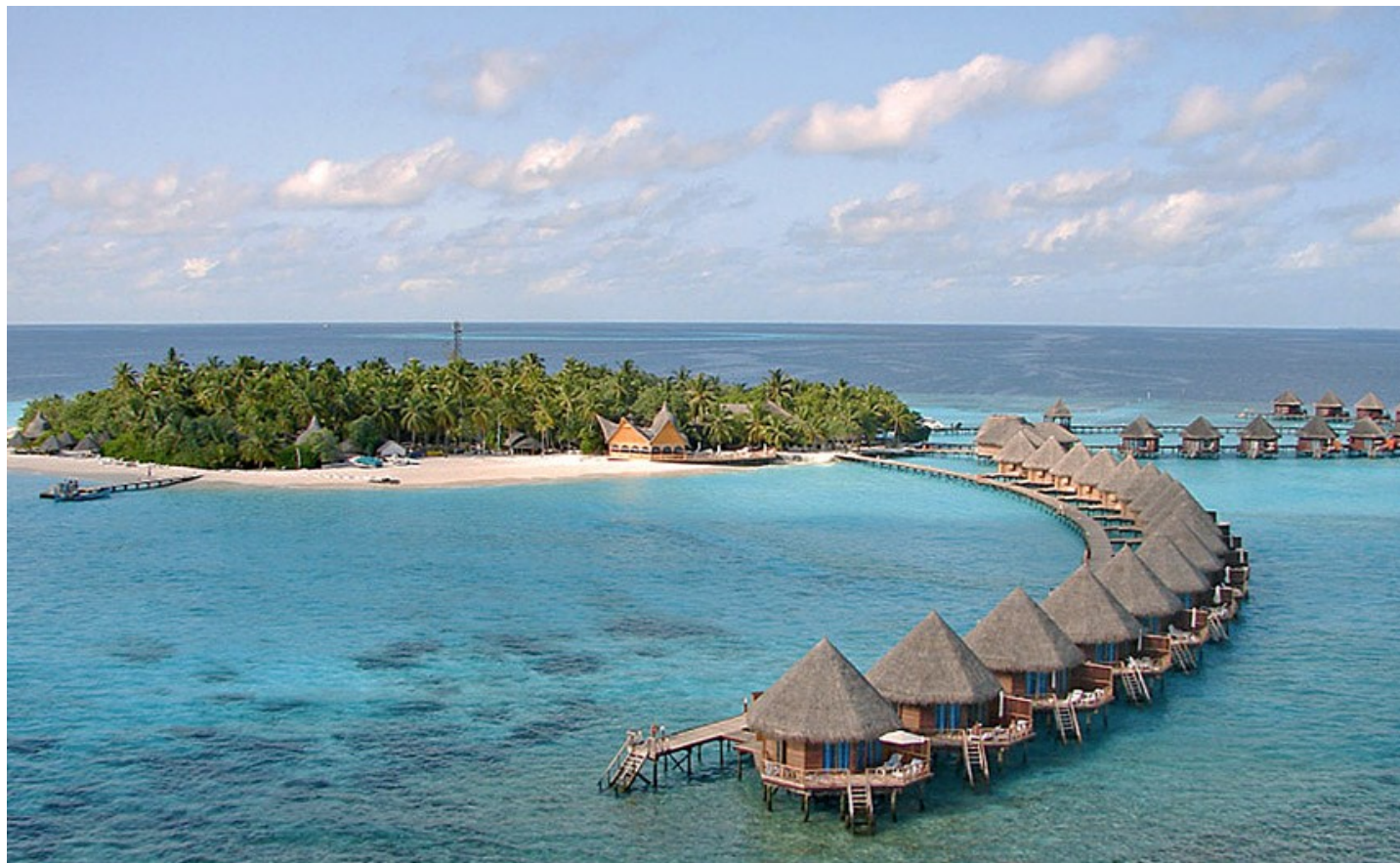
Nord Male Atoll