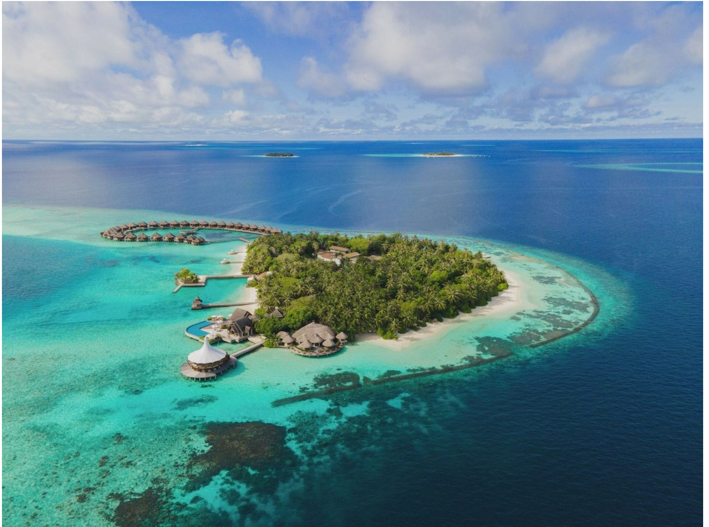
Nord Male Atoll