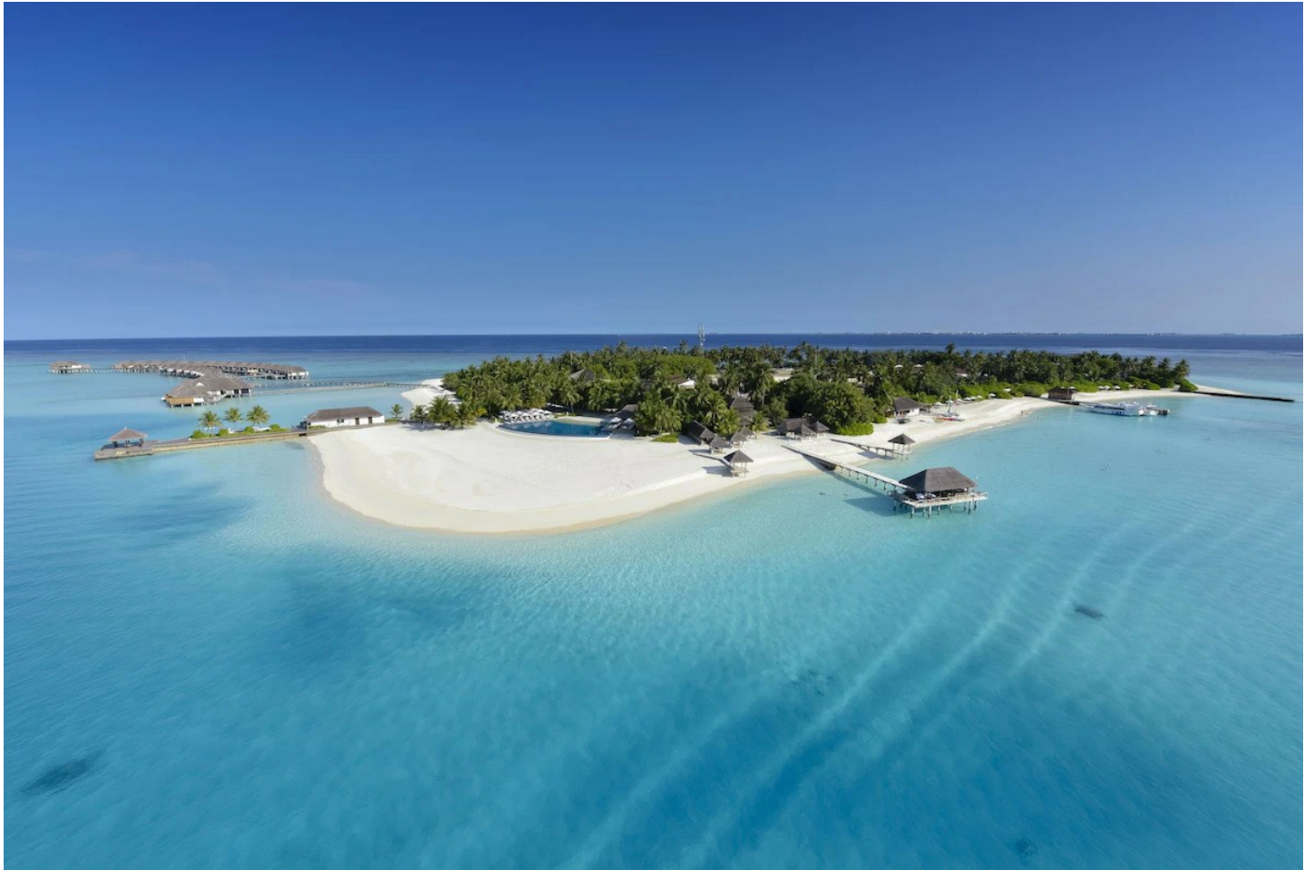
Süd Male Atoll