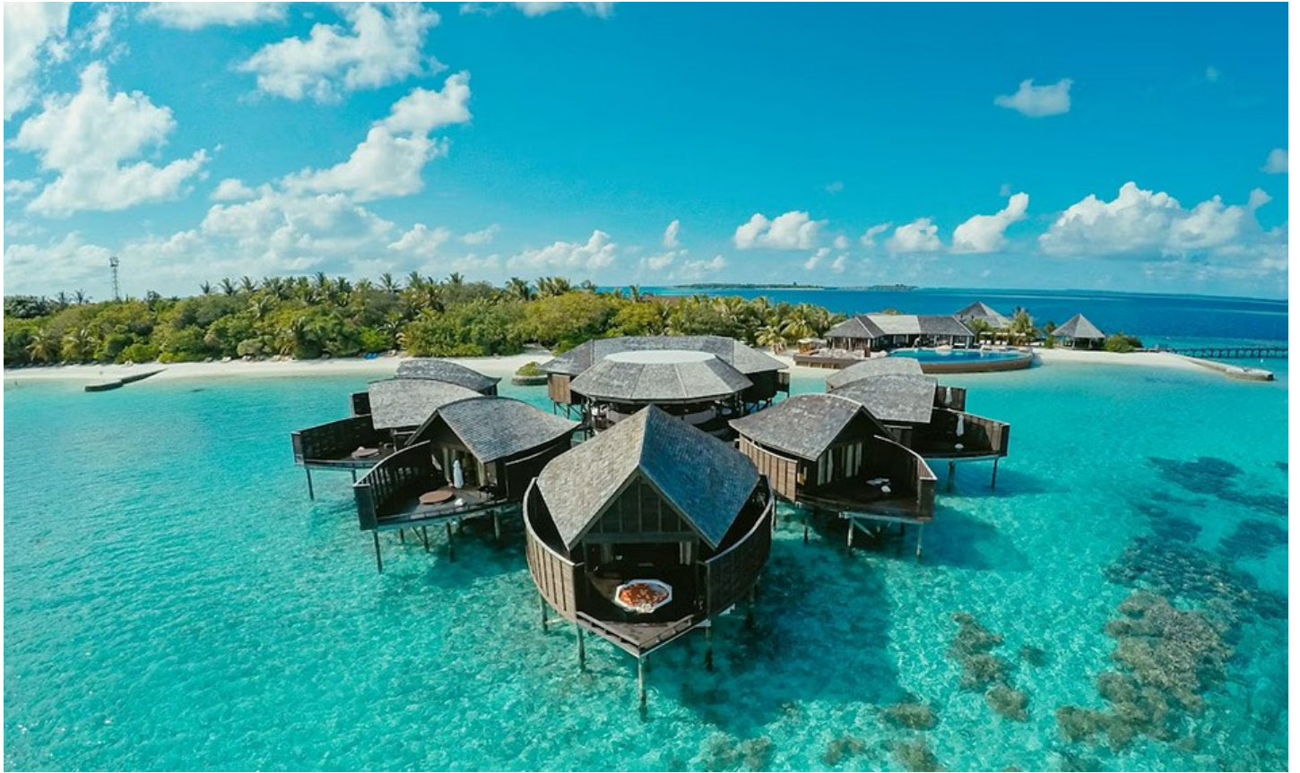
Süd Ari Atoll