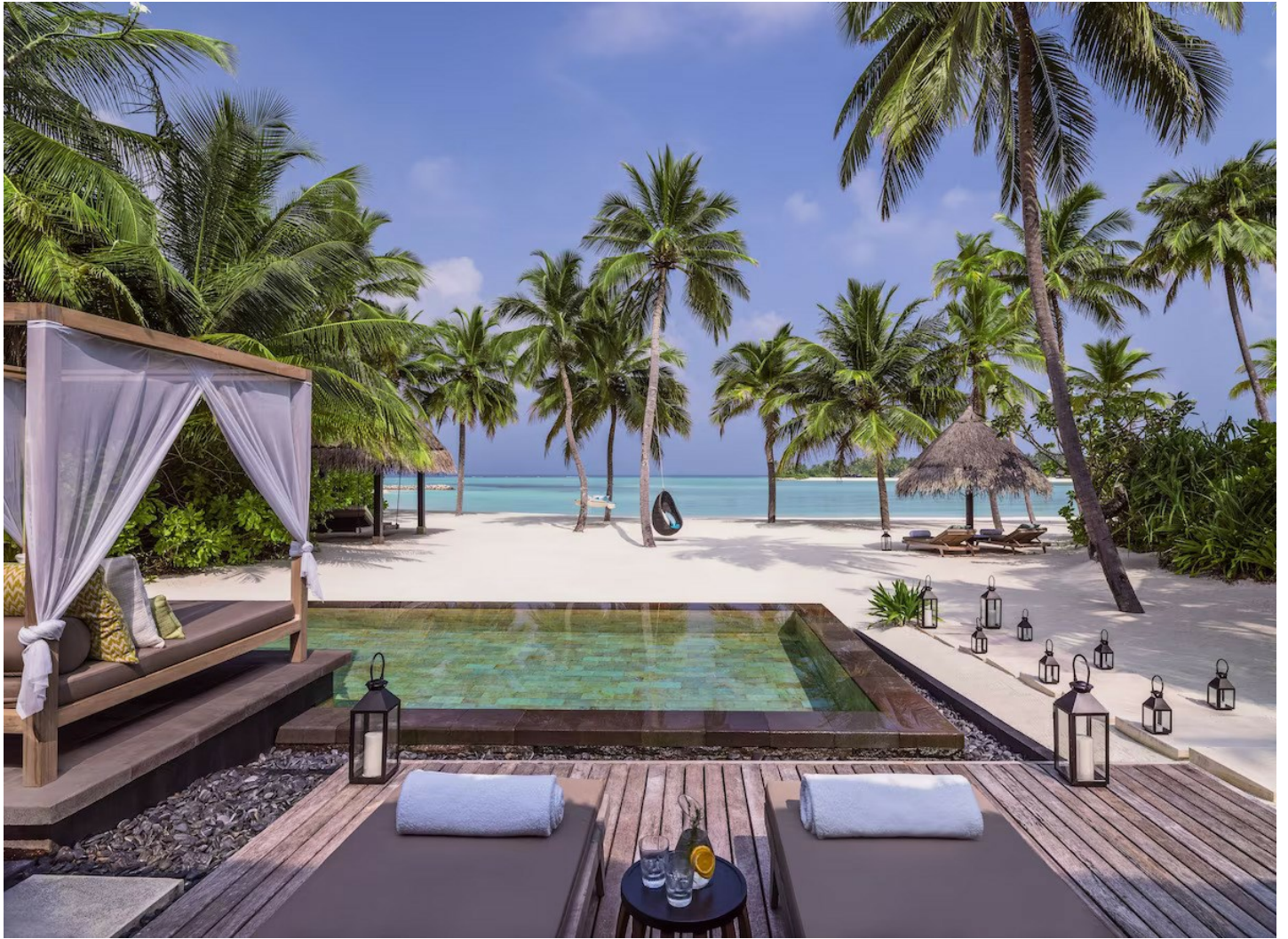
Nord Male Atoll