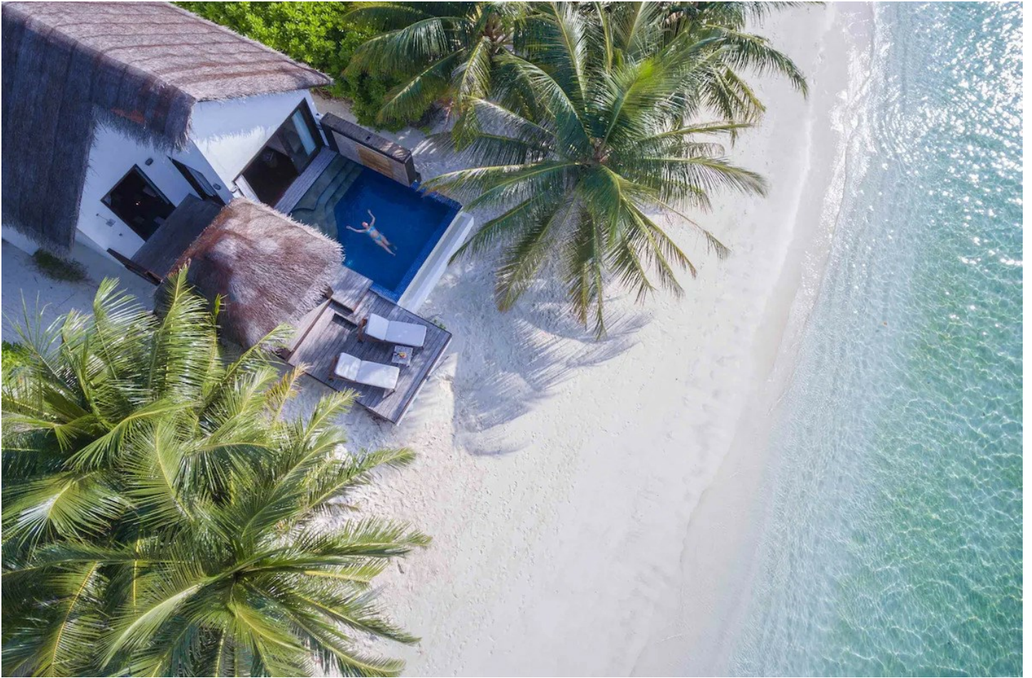
Nord Male Atoll