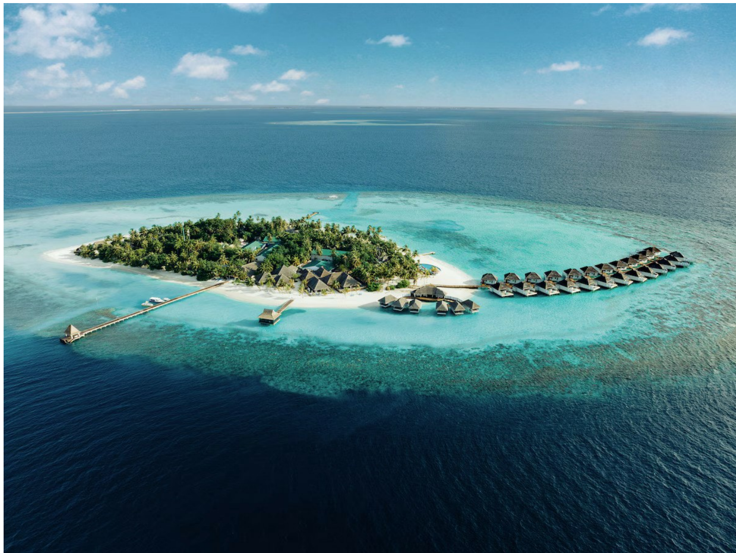
Süd Ari Atoll