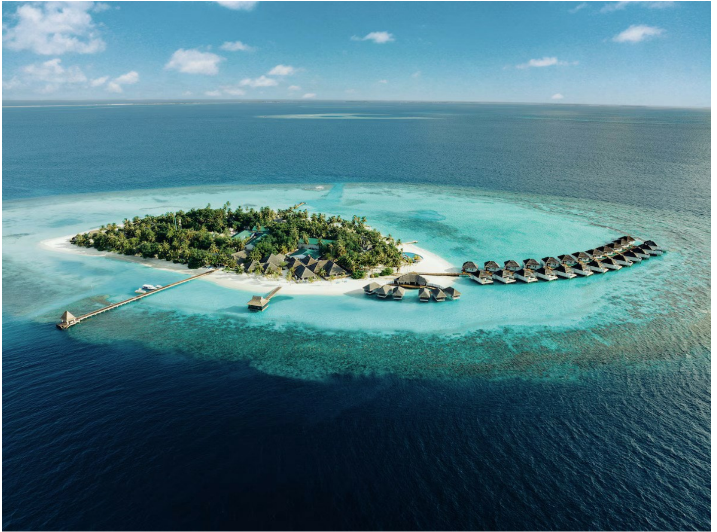
Süd Ari Atoll