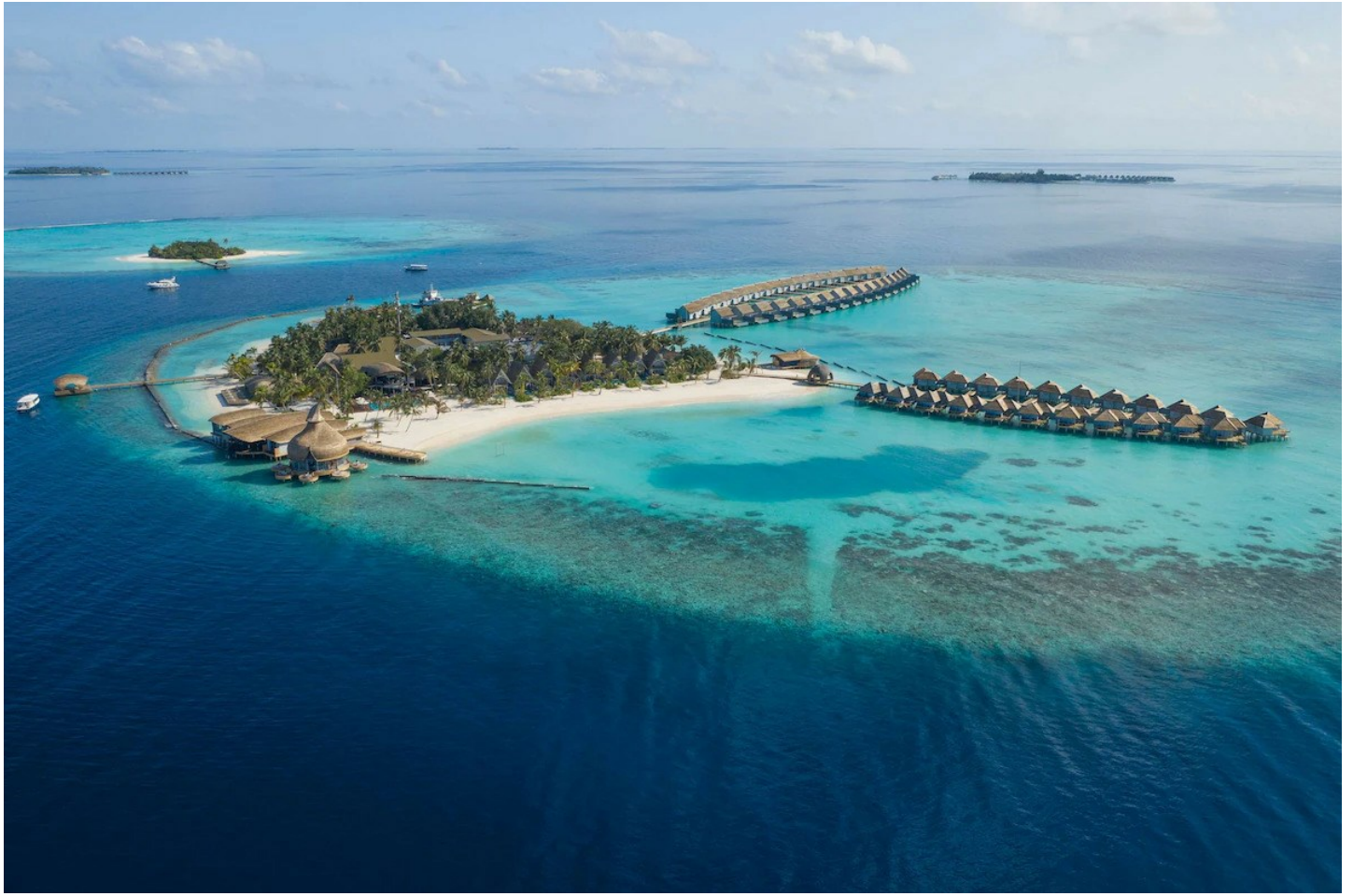
Süd Ari Atoll