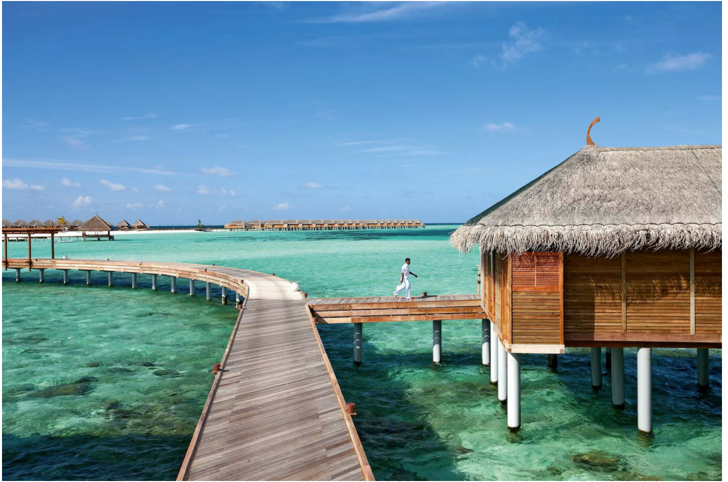
Nord Ari Atoll