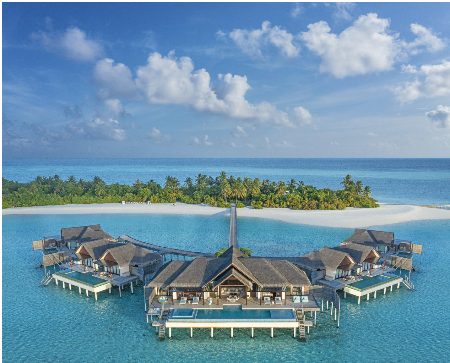
Süd Nilandhe Atoll