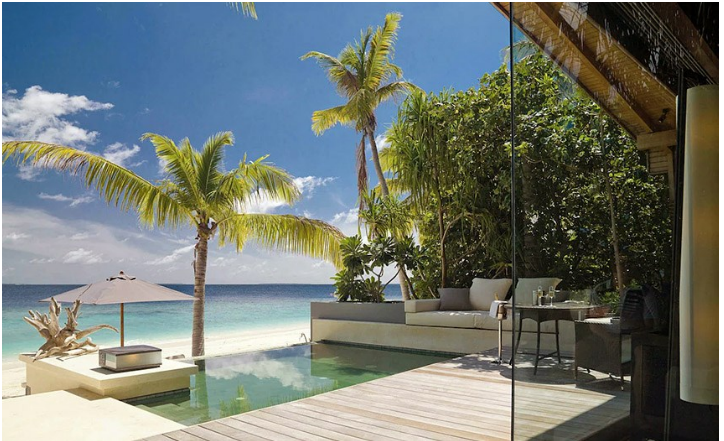
Gaafu Alifu Atoll