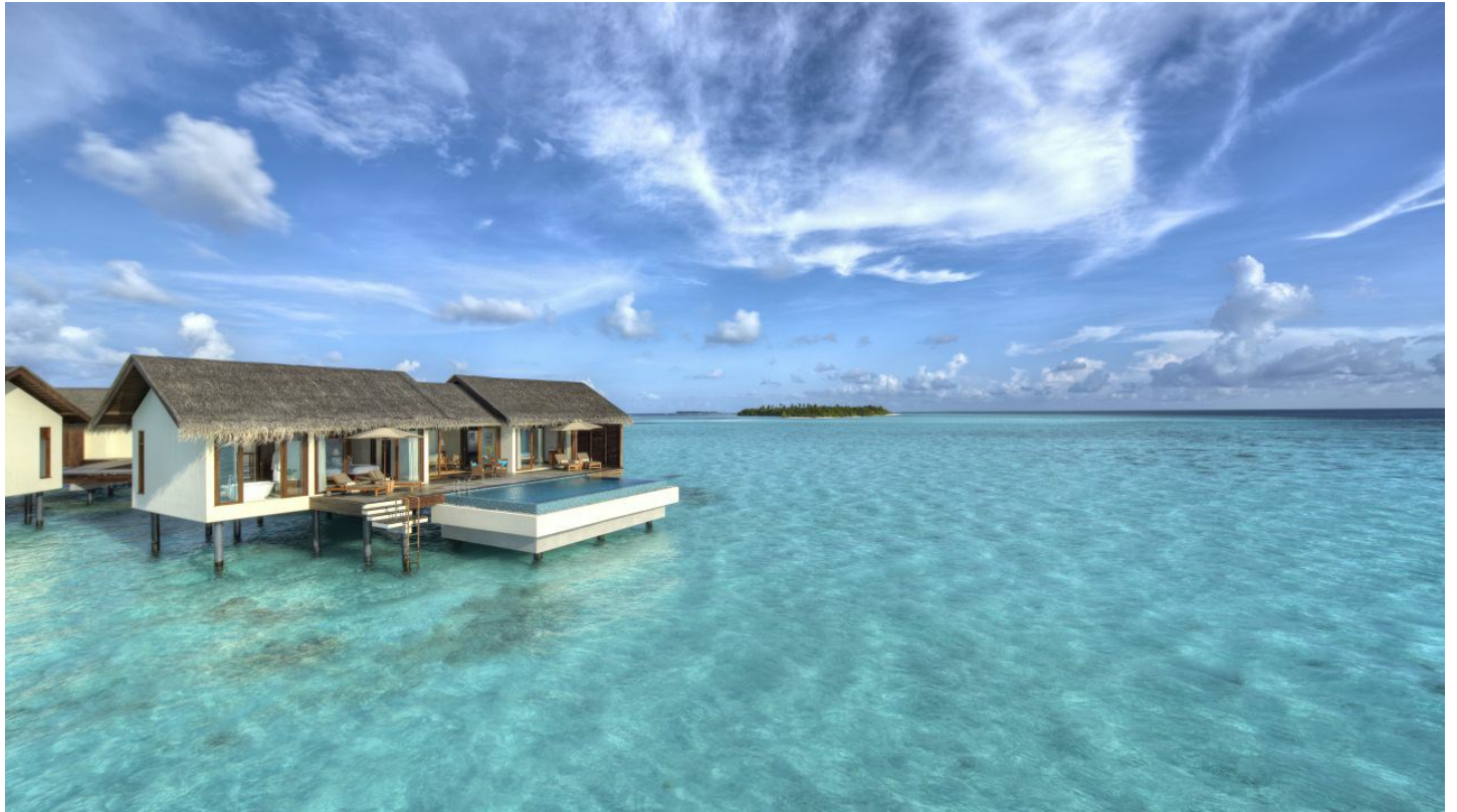
Gaafu Alifu Atoll