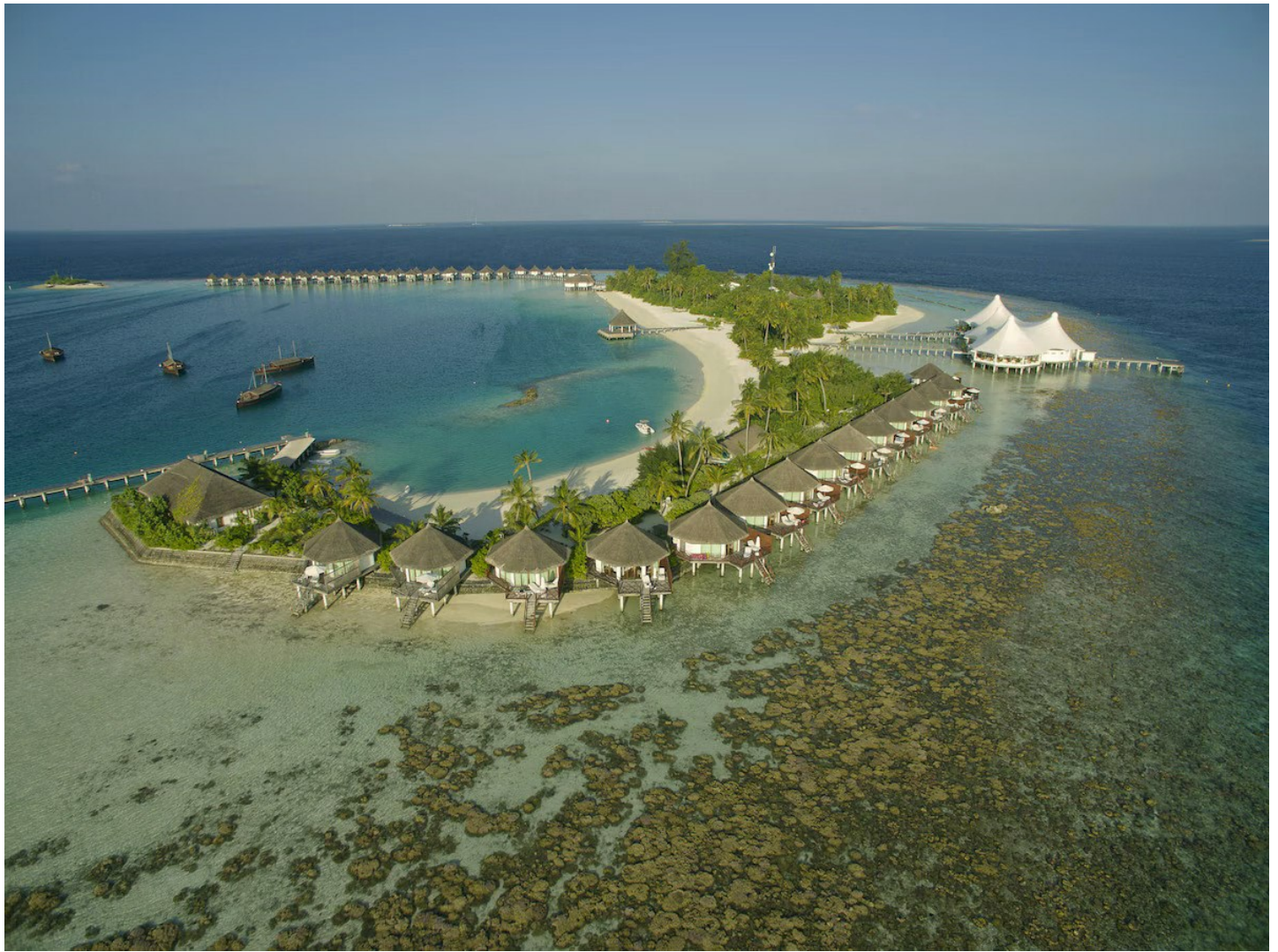
Nord Ari Atoll