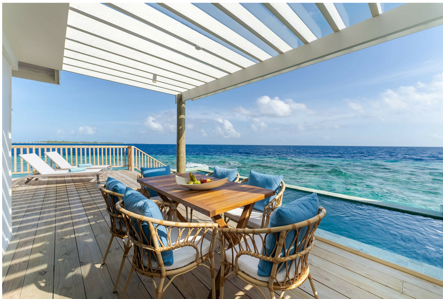
Nord Male Atoll