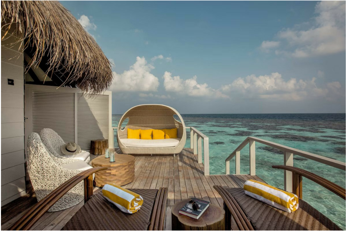
Süd Ari Atoll