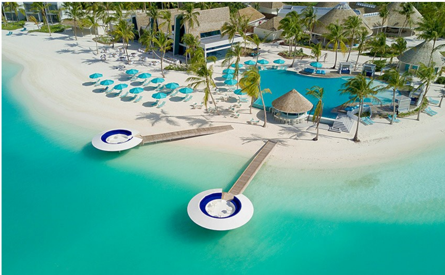
Süd Nilandhe Atoll