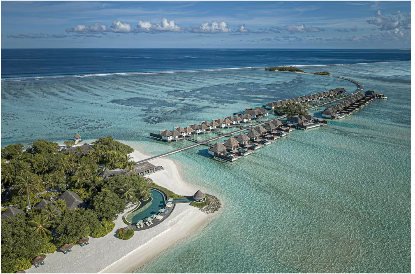
Nord Male Atoll