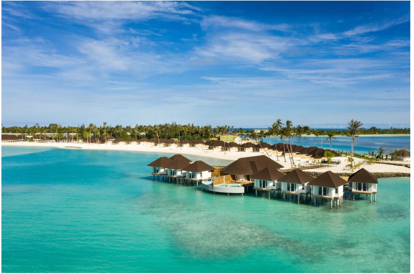
Süd Male Atoll