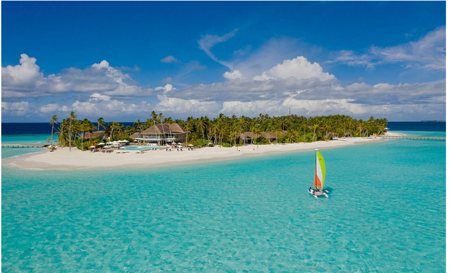
Süd Nilandhe Atoll