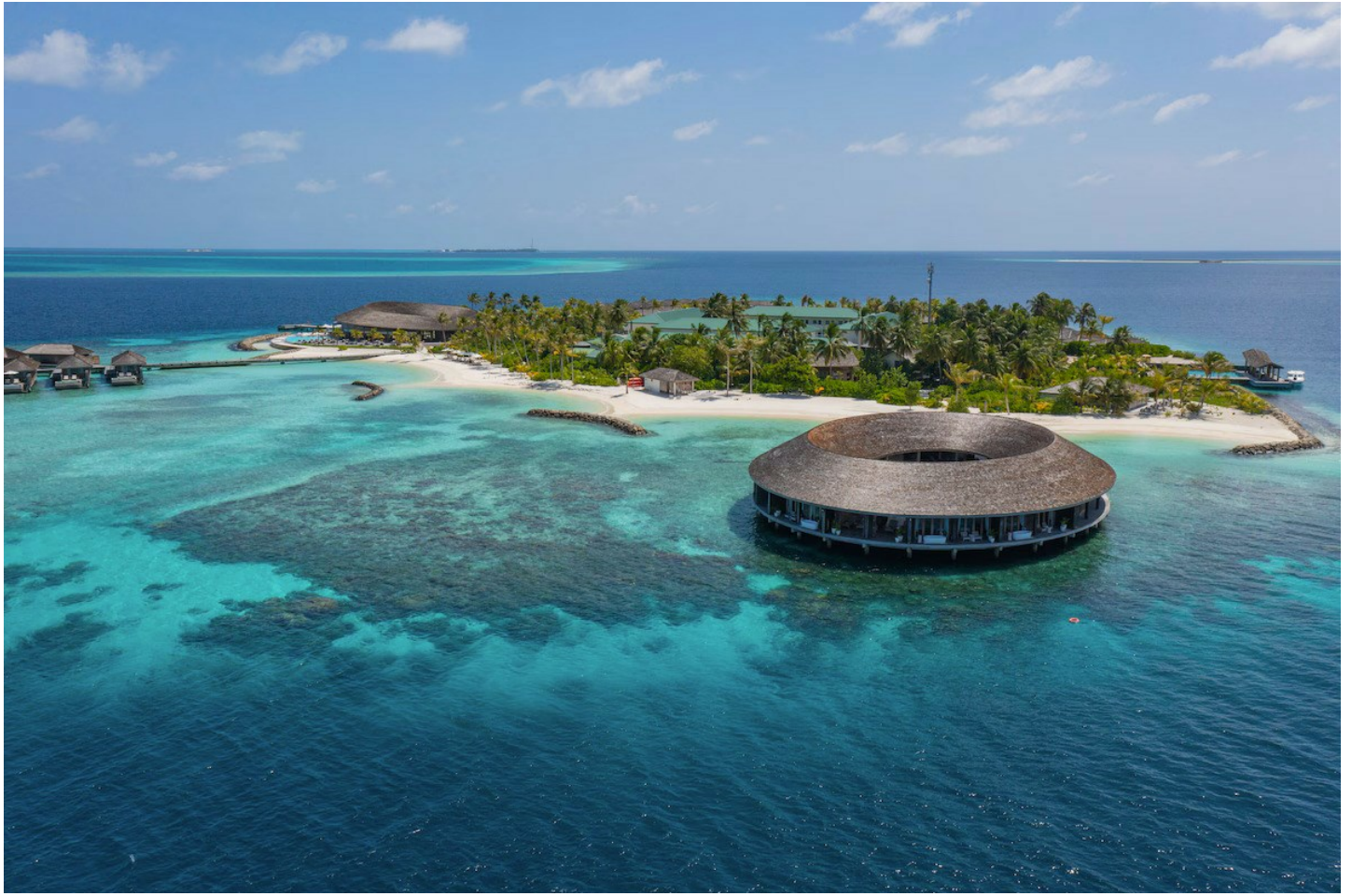
Nord Male Atoll