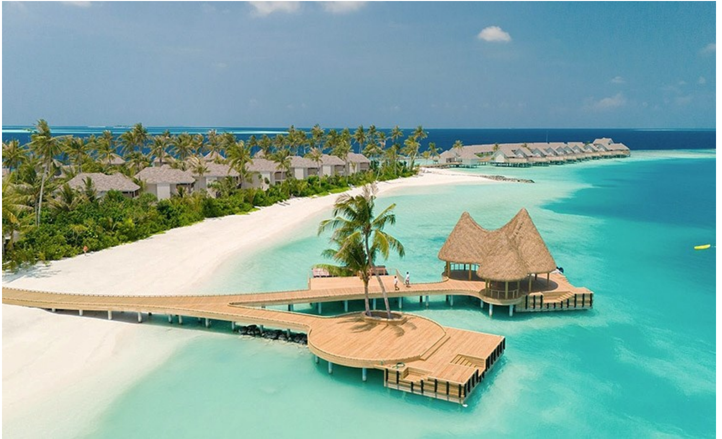
Nord Ari Atoll